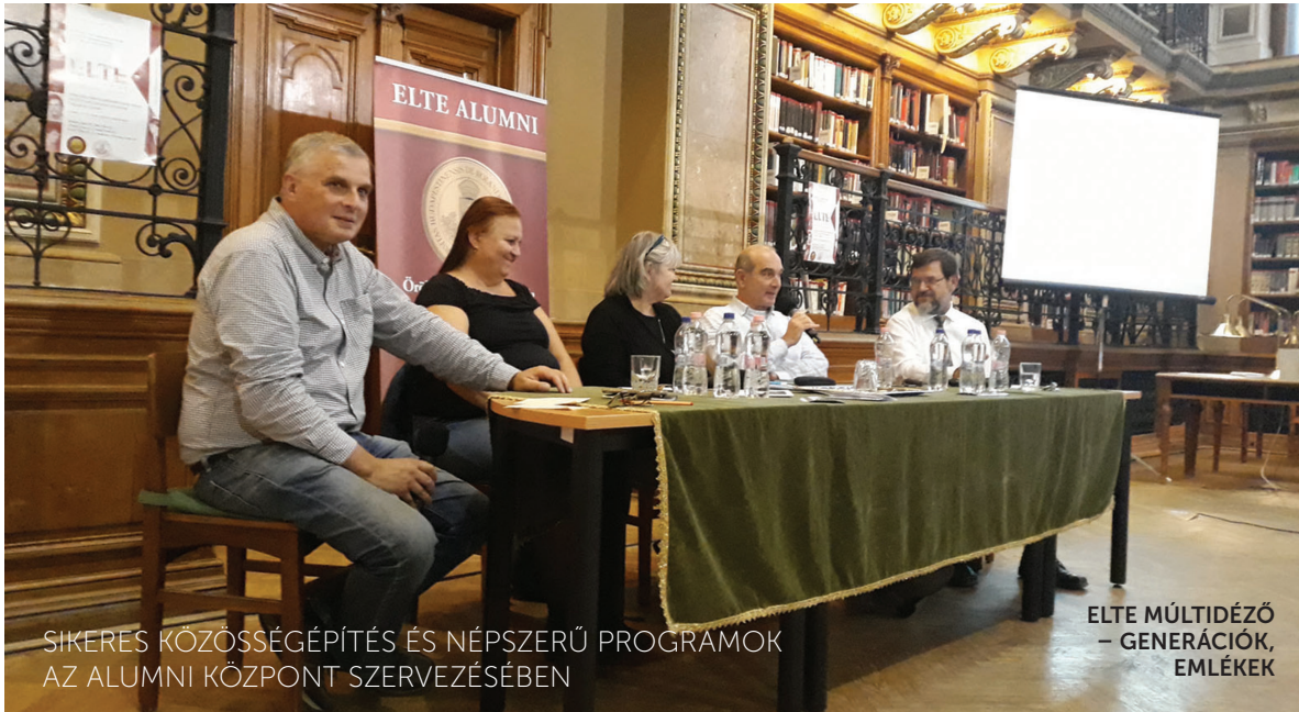
SIKERES KÖZÖSSÉGÉPÍTÉS ÉS NÉPSZERŰ PROGRAMOK AZ ALUMNI KÖZPONT SZERVEZÉSÉBEN